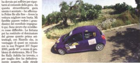
La Renault Clio di Pierluigi Maurino (Photo)